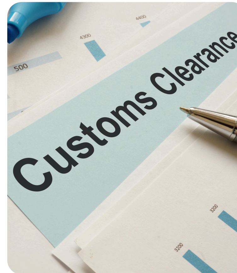
3. Гаалийн цахим бүрдүүлэлтийн хурд